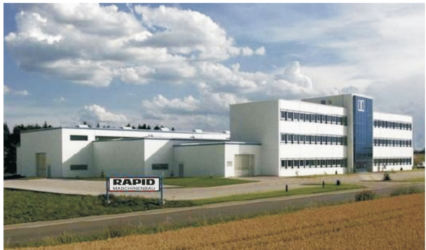
RAPID-Zentrale in Grosselfingen

rapid@rapid-maschinenbau.de www.rapid-maschinenbau.de