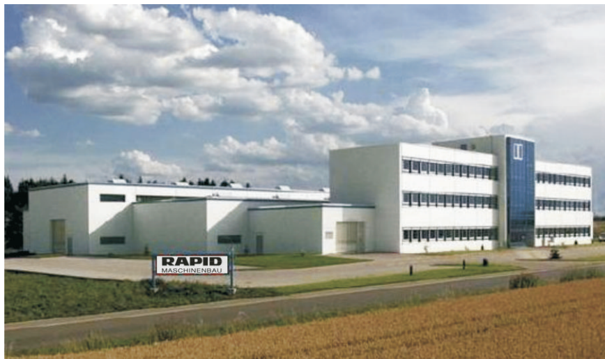
RAPID-Zentrale in Grosselfingen

rapid@rapid-maschinenbau.de www.rapid-maschinenbau.de