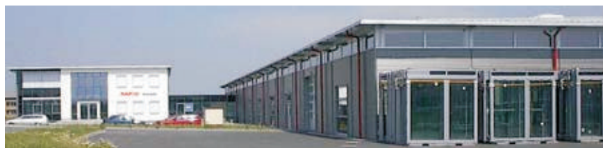
RAPID-Werk in Calau.